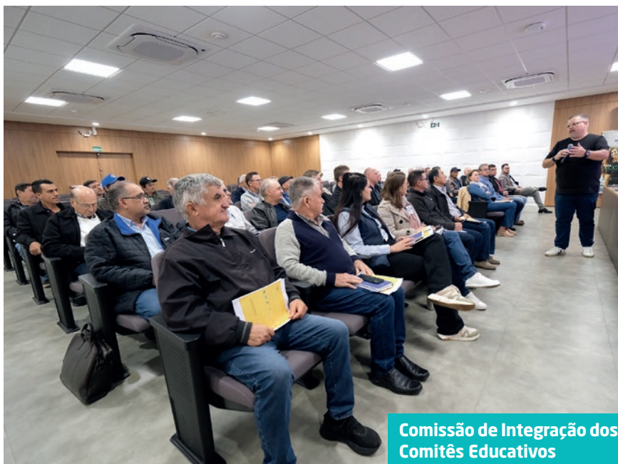
Comissão de Integração dos Comitês Educativos

Também foram discutidas as responsabilidades dos conselhos estatutários da C.Vale e a atuação dos Comitês Educativos como elo entre os cooperados, a CICE e o Conselho