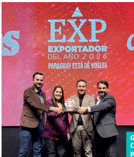
Gerente regional e gestores da C.Vale durante a cerimônia de premiação em Assunção

Presente no Paraguai desde 1998, com sete unidades de insumos e grãos, a cooperativa se desta-