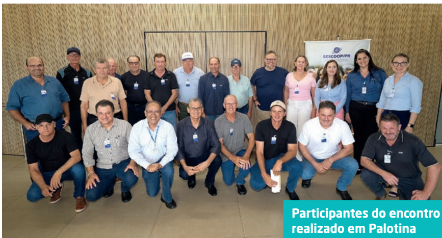
Participantes do encontro realizado em Palotina

Universidade Católica do Paraná (PUC/PR). Para ele, “a iniciativa da C.Vale reforça a importância da participação dos cooperados nas estruturas representativas da cooperativa e contribui para o fortalecimento de uma gestão cada vez mais participativa, transparente e alinhada aos princípios do cooperativismo”, destacou.