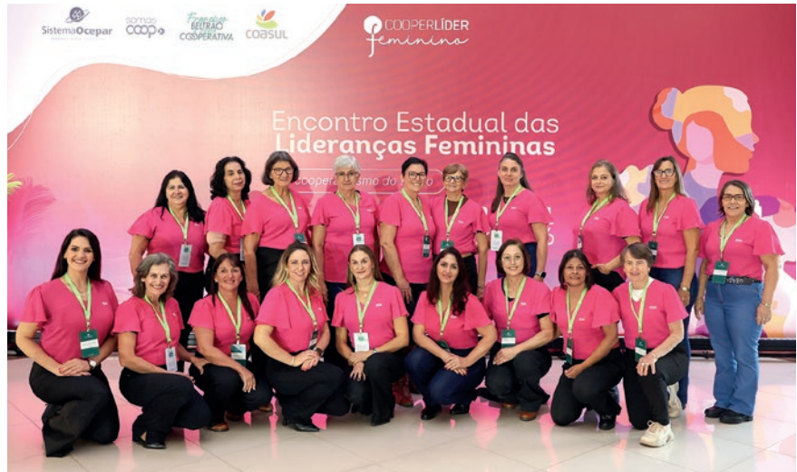
C.Vale foi representada no Cooperlíder, realizado em Francisco Beltrão, por 20 integrantes das coordenações dos Núcleos Femininos

O evento reuniu mais de 600 lideranças femininas de cooperativas de diferentes regiões do estado. O ambiente favoreceu aprendizado, integração e troca de experiências. Com o tema “O Cooperativismo do Futuro”, a programação abordou