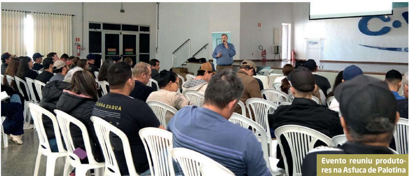
Evento reuniu produtores na Asfuca de Palotina