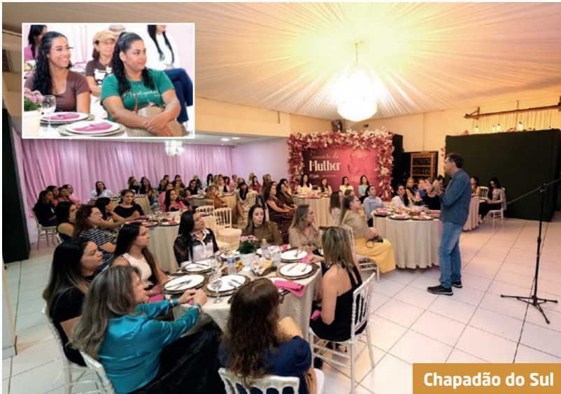
Chapadão do Sul