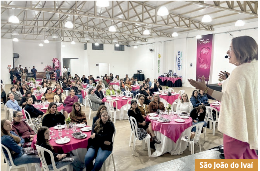
São João do Ivaí