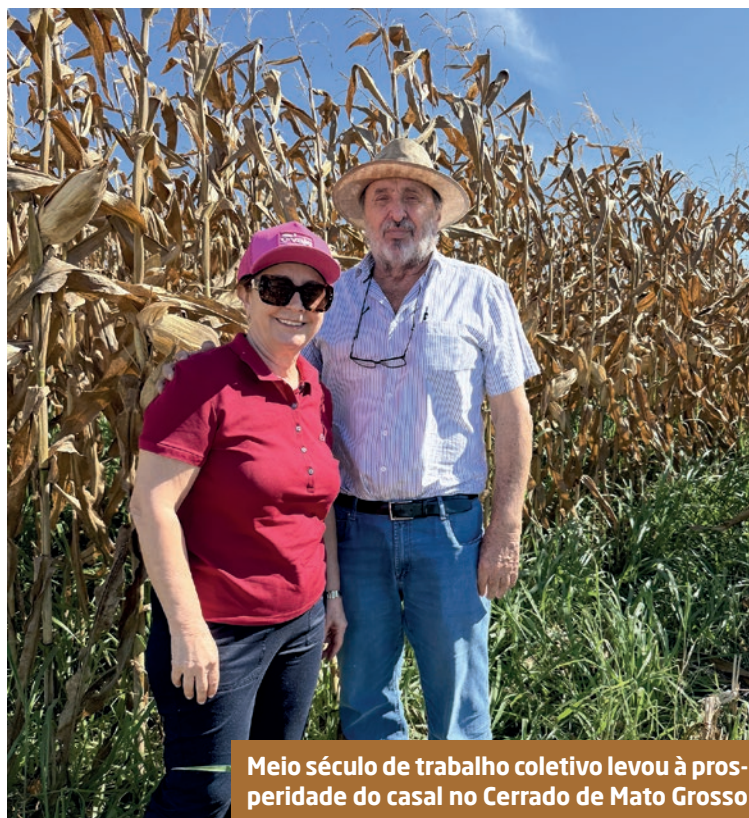
Meio século de trabalho coletivo levou à prosperidade do casal no Cerrado de Mato Grosso