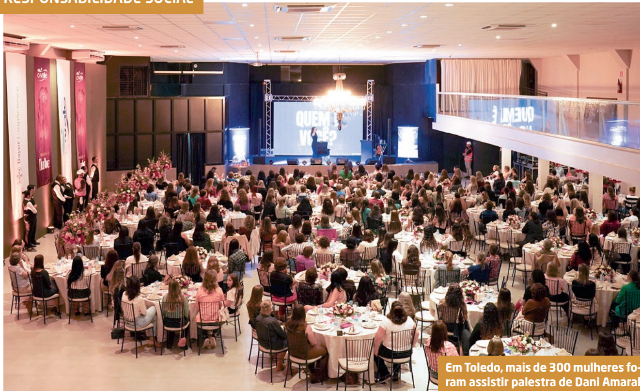
Em Toledo, mais de 300 mulheres foram assistir palestra de Dani Amaral