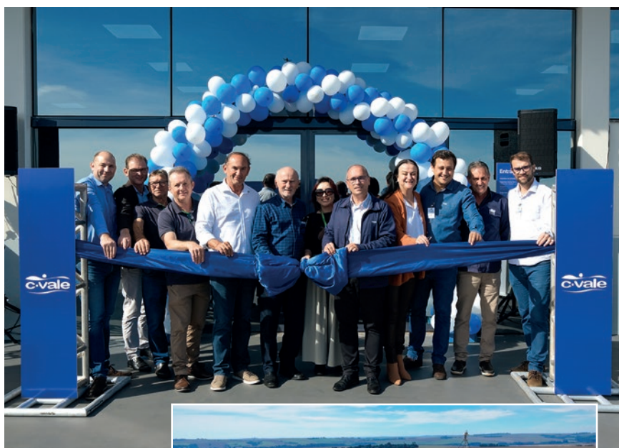
Cerimônia de inauguração na localidade de São Luiz do Oeste foi realizada no dia 15 de junho. A unidade fica às margens da PR-369