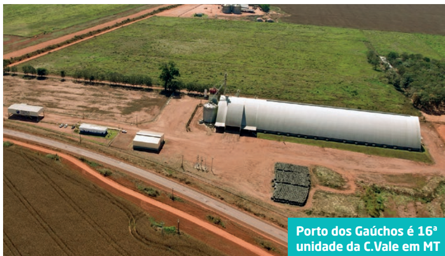
Porto dos Gaúchos é 16ª unidade da C.Vale em MT

“Estamos vivendo um novo ciclo da cooperativa aqui no estado e as aquisições dessas duas novas unidades e, também, da unidade de Porto dos Gaúchos representam bem este ciclo de investimentos e reestruturação da cooperativa”, afirma Rambo.