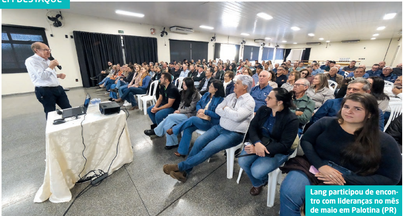
Lang participou de encontro com lideranças no mês de maio em Palotina (PR)