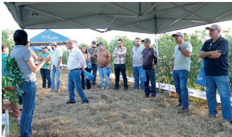
100 produtores participaram do Dia de Campo de Mandioca em Umuarama