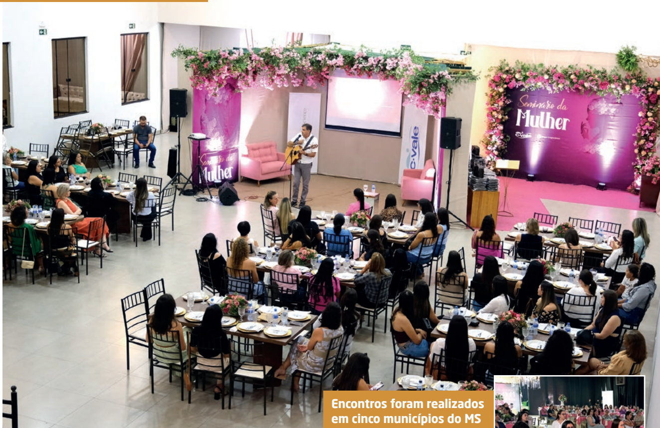
Encontros foram realizados em cinco municípios do MS