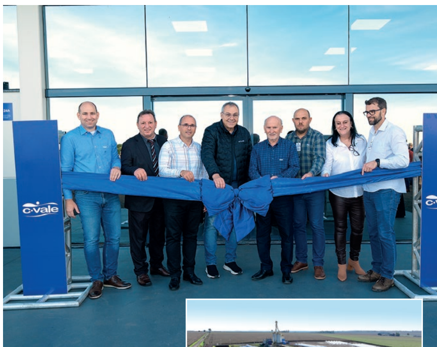
Diretores e funcionários da C.Vale e autoridades de Toledo descerram fita em Vila Nova. A estrutura da localidade tem 7,26 hectares e fica ao lado da PR-239