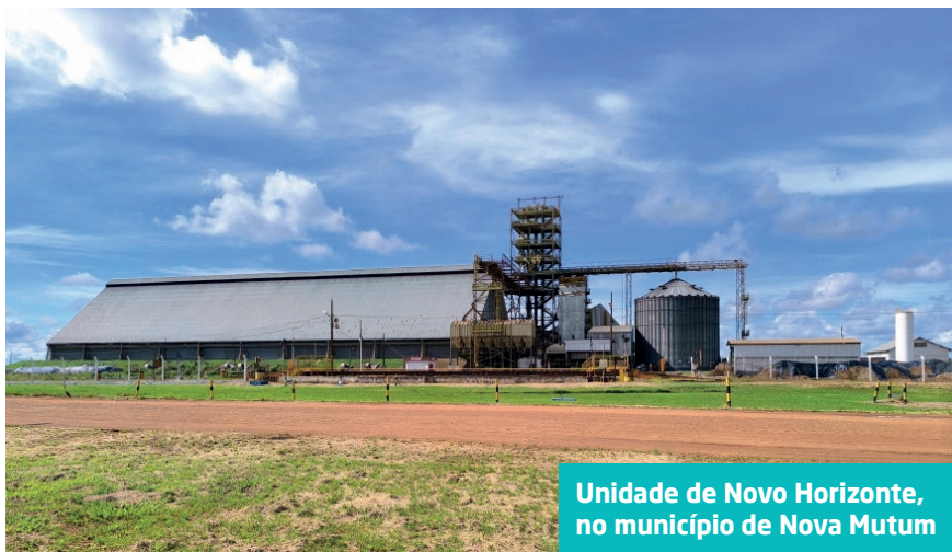
Unidade de Novo Horizonte, no município de Nova Mutum