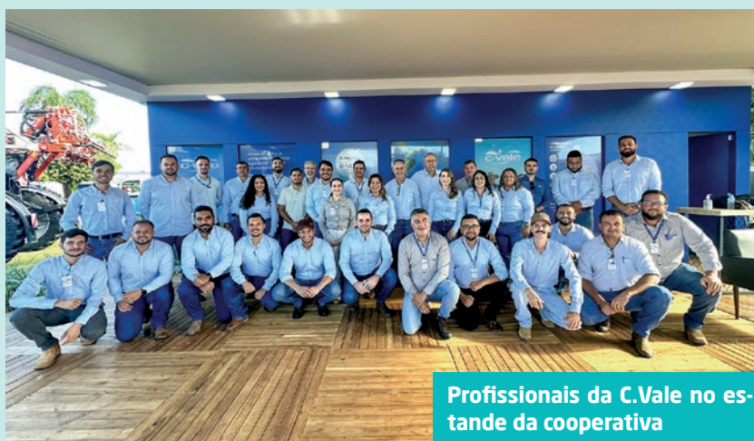
Profissionais da C.Vale no estande da cooperativa

A cooperativa contou com estande estruturado, com salas climatizadas, espaço para atendimento de associados e visitantes e degustação de produtos. O público experimentou itens da linha de carnes de frango e tilápia, além de conservas e suco de uva comercializados pela C.Vale.