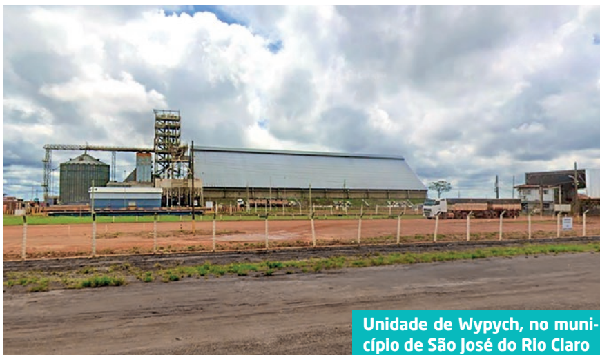
Unidade de Wypych, no município de São José do Rio Claro