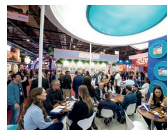
Equipe comercial da CVale Alimentos durante a feira em São Paulo

Um dos destaques foi o lançamento da embalagem pouch de empanados (275 g), trazendo mais praticidade ao consumidor. A novidade otimiza espaço, reduz desperdícios e agrega valor ao varejo.