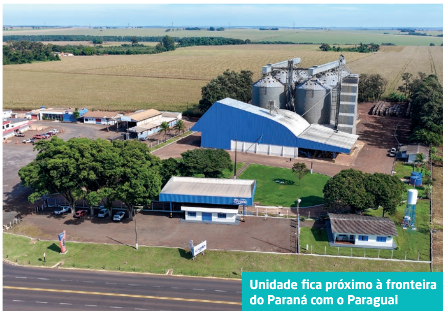
Unidade fica próximo à fronteira do Paraná com o Paraguai

A unidade de Maracaju dos Gaúchos possui armazéns para