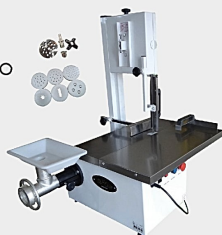
Serra Fita DO CHEFF Mesa/Mov/C/Moedor/Extr Cód.: 1072423