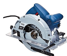
Serra Circular 7.1/4 1350W 127V TRAMONTINA Cód.: 558140