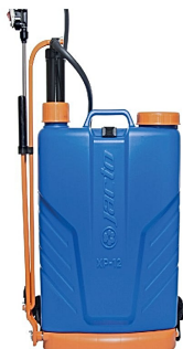
Pulverizador Costal Manual Jacto XP 12L