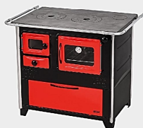
Fogão Lenha Supreme N°2 Vermelho Box HIDRO Cód.: 1101381