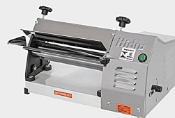
Cilindro Elétrico HIDRO HB 250 INOX Cód.: 66137