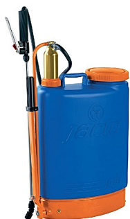
Pulverizador Costal Manual JACTO PJH 20L