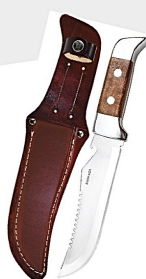
Faca Esportiva 7\"/>