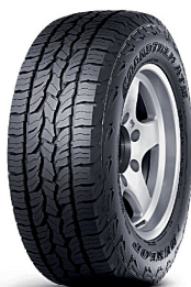
Pneu 245/70R16 111T DUNLOP Grandtrek AT5