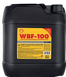
Óleo SHELL WBF100 CX TRAT HID 20L