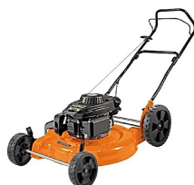
Cortador Grama Gasolina TRAMONTINA 6HP CC50M Cód.: 1076139