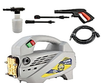
Lavadora ZM L6/12 220/240V Cód.: 1133063