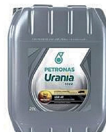
Óleo PETRONAS Urania 3000SE 15W40 CI4 20L