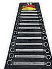
Jogo Chave Estrela 6 A 32MM TRAMONTINA