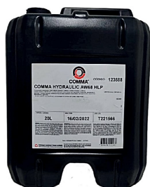
Óleo Hidráulico COMMA AW68 HLP 20L