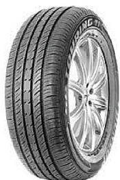
Pneu 175/70R14 88T DUNLOP SP Touring R1