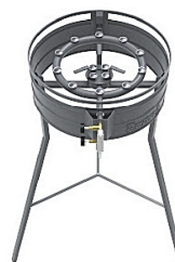
Fogareiro ZORZINCO Queimador Duplo Cód.: 129072